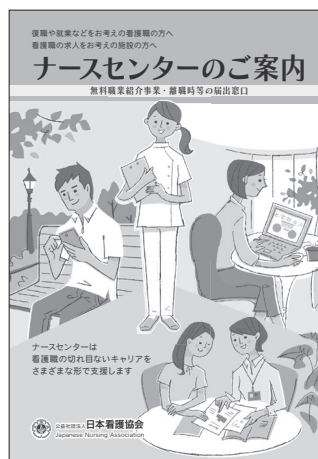
1.4 ナースセンターのご案内